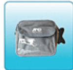
Кейс для хранения и переноски – 1 шт.