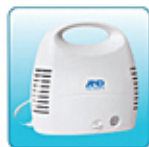
Основной блок в корпусе – 1 шт.