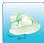
Респираторная маска для детей – 1 шт.