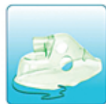
Респираторная маска для взрослых – 1 шт.