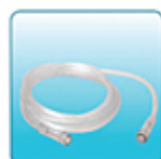
Соединительная трубка – 1 шт.