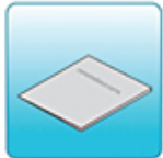
Руководство по эксплуатации (на русском языке) и гарантийная карта – 1 шт.