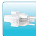
Емкость для лекарства – 1 шт.