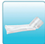
Насадка для рта – 1 шт.