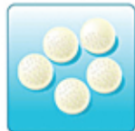
Воздушный фильтр – 5 шт.